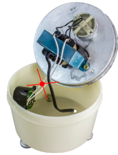
Рис. 2 – Внутренняя часть лампы

Для использования лампы без звуковой сигнализации (сирены), нужно перерезать или отпаять белый провод (рис. 2), соединяющий плату управления со звуковым модулем