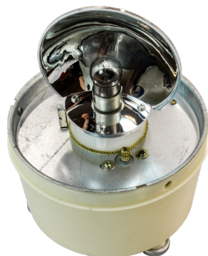
Рис. 1 – Отражатель